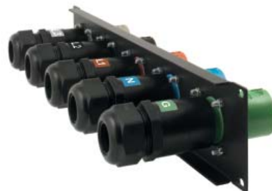
Set di 5 connettori Panel Source (sopra) e Panel Drain (sotto) con backshell