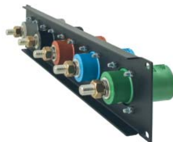
Set di 5 connettori Panel Source (sopra) e Panel Drain (sotto) con M12 filettati